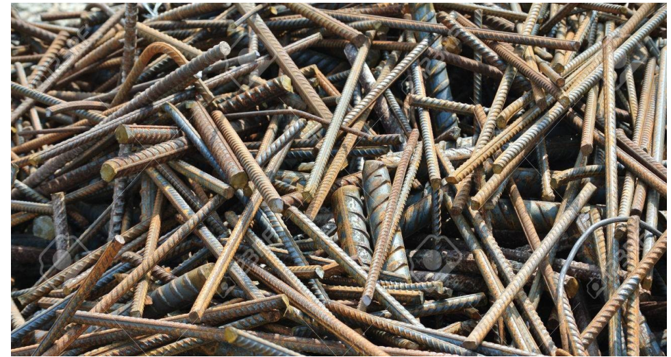
17 04 05 Železo a ocel