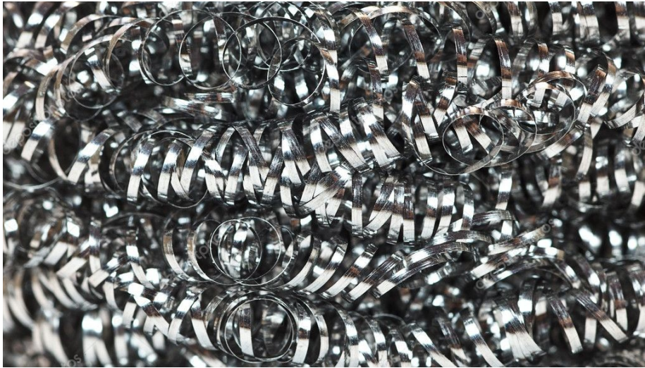
12 01 01 Piliny a třísky železných kovů