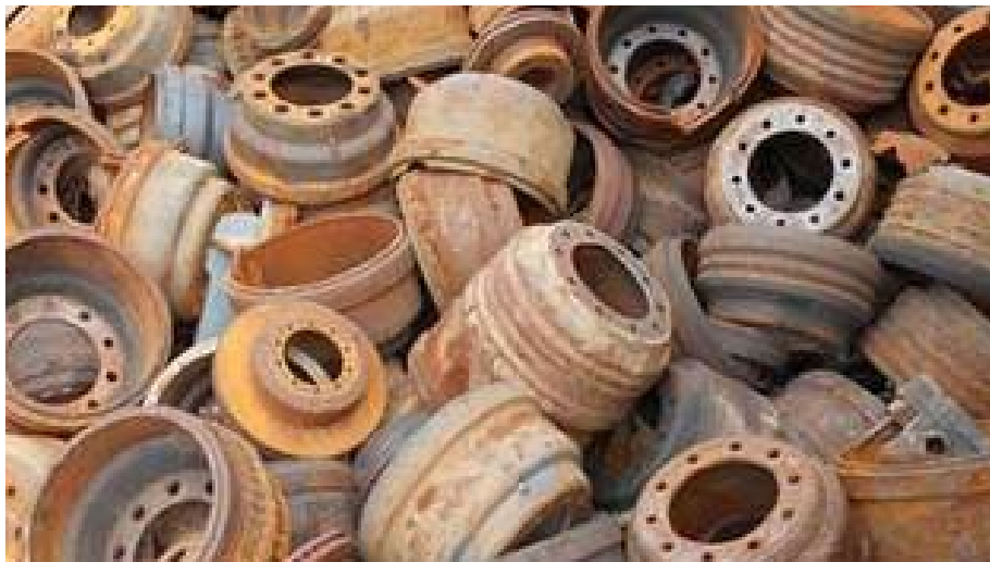
16 01 17 Železné kovy