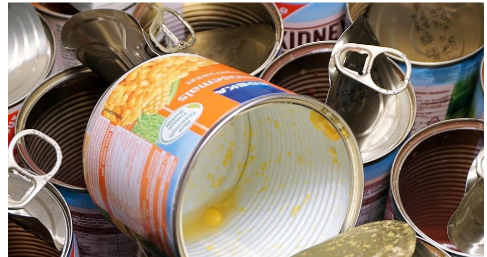
20 01 40 Kovy