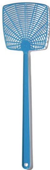
Plácačka na mouchy