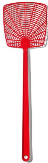
Plácačka s insekticidem, repelentem nebo atraktantem