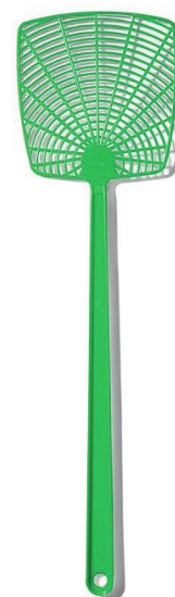
Plácačka s konzervanty plastu