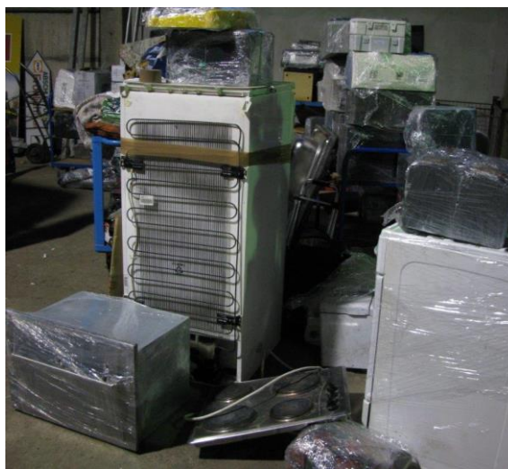
Obrázek 10 – Nevyhovující – Jednotlivé kusy jsou zabalené pouze do strečových fólií nebo nejsou zabaleny vůbec