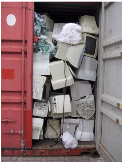
Obrázek 7 – Nevyhovující – Volně ložená zásilka