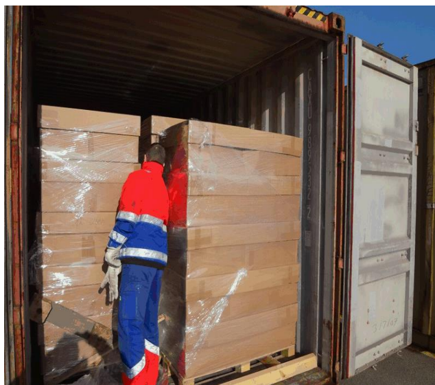
Obrázek 6 – Vhodné zajištění uspořádání zásilky