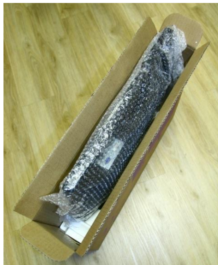
Obrázek 4 – Před vložením do krabice a fixací je LCD monitor obalen bublinkovou fólií

Příklady doporučeného uspořádání zásilky a přípustného balení více kusů v jednom obalu