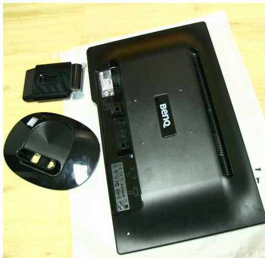
Obrázek 3 – Demontáž stojanu monitoru před zabalením

Doporučená demontáž a balení výrobků a dílů citlivých na mechanické poškození: