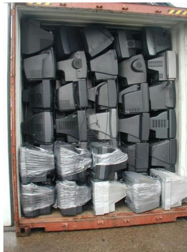
Obrázek 8 – Nevyhovující – Zásilka je uspořádaná, ale elektrozařízení nejsou samostatně balena a vhodně zafixována