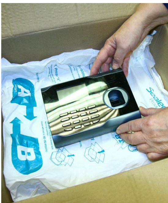
Obrázek 1 – Fixace elektrozařízení v obalu pomocí pěnových fólií