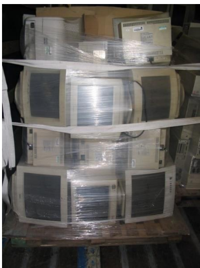
Obrázek 9 – Nevyhovující – Paleta je obalena strečovou fólií a zajištěna fixačním pásem, ale nejsou zabaleny a zabezpečeny jednotlivé kusy elektrozařízení a jejich citlivé části