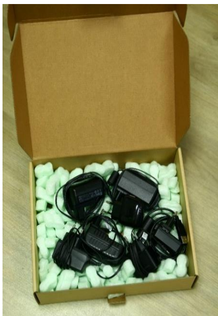
Obrázek 5 – Přípustné balení více výrobků v rámci jedné krabice

Příklady doporučeného uspořádání zásilky a přípustného balení více kusů v jednom obalu