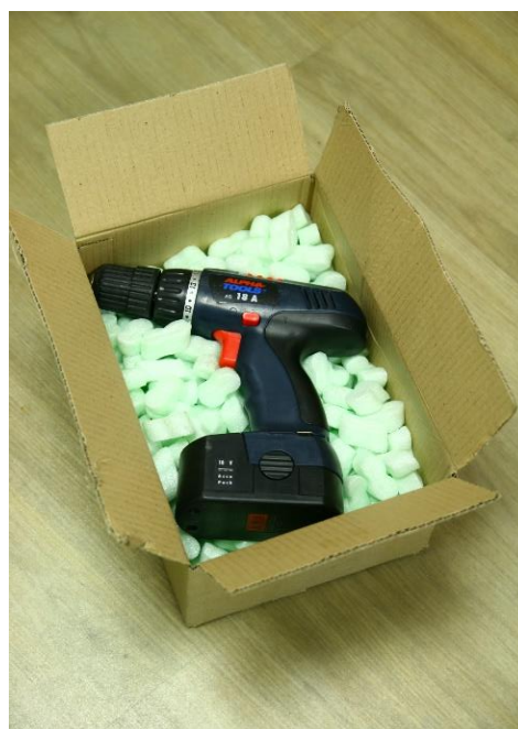
Obrázek 2 – Fixace elektrozařízení v obalu pomocí FLO-PAK tělísek